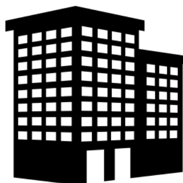
Многоквартирный жилой дом