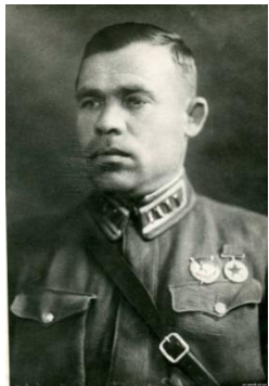
Мухин Г. В. советский военный деятель, генерал-майор